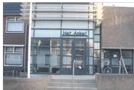
In Katwijk Bijbel het IDP samen in Het Anker.

Het dovenpastoraat wordt ondersteund door plaatselijke kerken. Zonder die steun, zou dit werk onder doven niet kunnen bestaan en is dus erg belangrijk. Wist u overigens, dat er wekelijks in Het Anker een dienst voor doven is. Die diensten staan ook open voor iedereen en uw bezoek wordt erg op prijs gesteld. Waarom? Omdat dat de integratie van doven in onze maatschappij bevordert. Na het gesprek met Wim heb ik het goede voornemen zo'n dienst bij te gaan wonen, komt u ook.